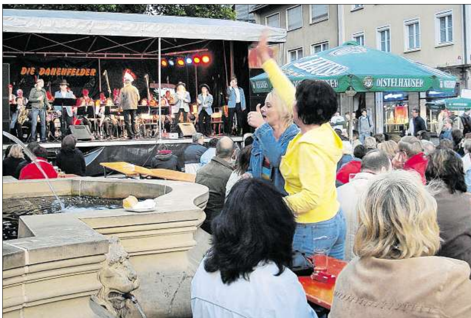
Donnerstags in der City: Selbst bei schlechtem Wetter war das Konzert des Musikvereins Dahnfeld gut besucht.

Bei „Donnerstags in der City – hier spielt die Musik“ stehen am Donnerstag, 12. Juli die „Molly Malones“ von 19-21 Uhr auf der Bühne. Sie haben sich ganz dem traditionellen irischen und schottischen Folk verschrieben. Die fünf Frauen aus dem Heilbronner Raum verbindet, so verschieden sie auch sein mögen, ihre Liebe zur dieser Musik. Schwerpunkt bilden wunderschöne irische Balladen. Zum Repertoire gehören aber auch die schwungvollen Jigs, Reels und Polkas. Mit den dazugehörigen eindrucksvollen Erzählungen über Land und Leute wecken die „Molly Malones“ die Begeisterung des Publikums und das Fernweh nach der grünen Insel. Ebenfalls vor Ort ist das Tigermobil der Stadt Neckarsulm, das den jungen Besuchern ab 17 Uhr wieder viele Spiel-Ideen und Spielaktionen bietet. (NST)